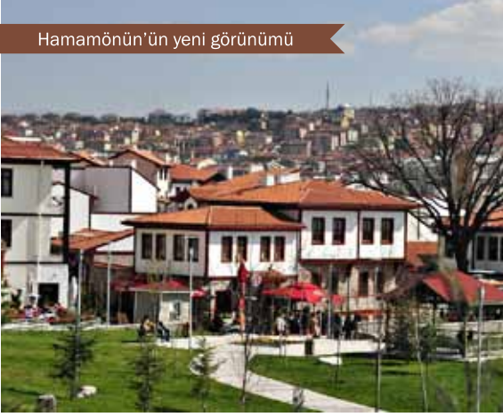
Hamamönü'nün yeni görünümü

dırdığı gibi yeni sosyal mekanlara da kavuşulmuş olundu. Örneğin Ankara'da ilk önce Hamamönü ve Samanpazarı civarında, daha sonra Hacı Bayram Camii civarında gerçekleştirilen ve halen devam eden restore çalışmalarıyla şehir kaybettiği ruhuna ve kültürüne geri döndü.