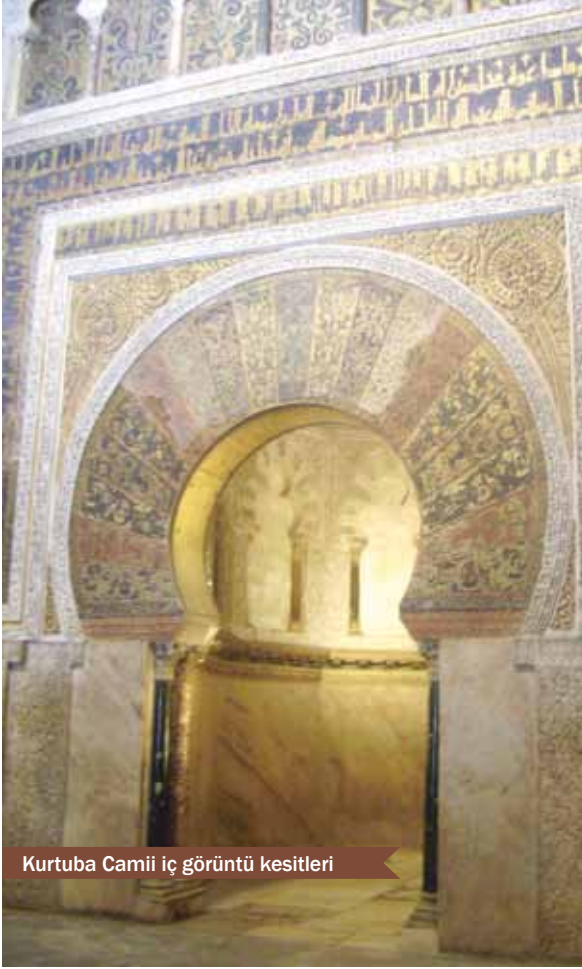
Kurtuba Camii iç görüntü kesitleri