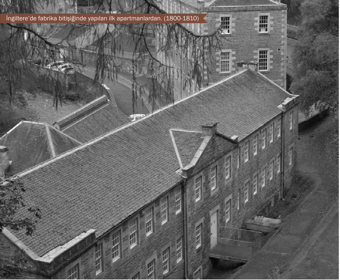
İngiltere'de fabrika bitişğinde yapılan ilk apartmanlardan. (1800-1810)

larken giderlerini minimize, kârlarını maksimize etme peşlerine düştüler. Kadınların ve çocukların günde on dört saat düşük ücretlerle çalıştırılmaları, sağlıksız ortam ve beslenme koşulları bu sürecin bilinen özellikleridir. Bu fabrikaların yol açtığı hava kirliliği yüzünden meselâ Londra'da bir günde 4000 kişi ölmüştür. Modern Batı'nın bugünkü refah seviyesine uzun dönemler acımasızca sömürdüğü işçi ve mazlumların sefaleti ve kölelerin gözyaşı ile ulaştığını unutmamak gerekir.